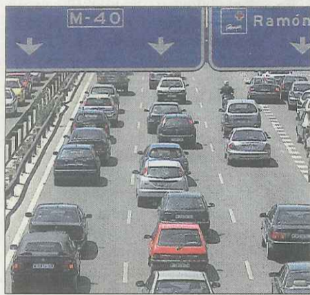
Congestión en la autopista M-40.

La obra ha sido realizada por el Ministerio de Fomento. Cuenta con tres enlaces, dos de ellos en el comienzo y final de la variante, y otro central que conecta con la carretera M-129. Su coste ha ascendido a 42 millones de euros.