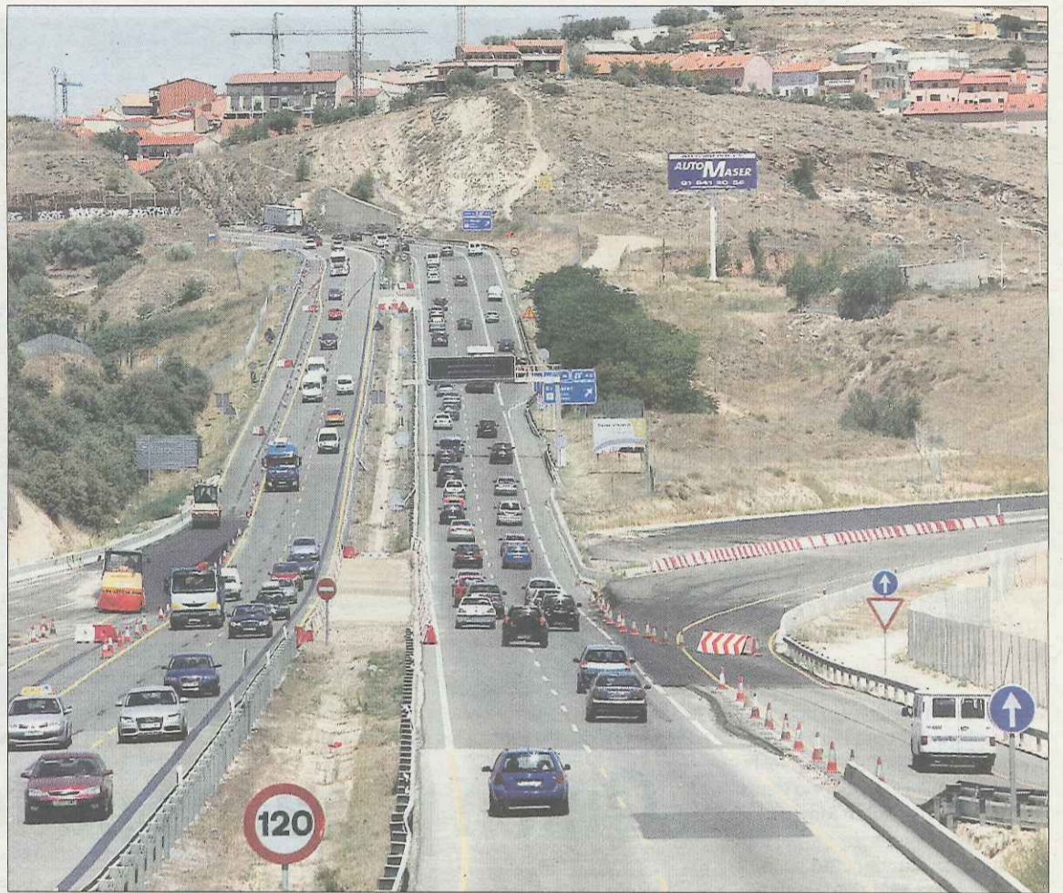
Imagen de hace unos días de la A-1 a su paso por El Molar, con la variante a punto de ser abierta.

En este sentido, existían en el municipio «12 entradas que no cumplían ninguna normativa, ya sea española o europea», agrega De Frutos.